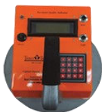
PQI 100 1998