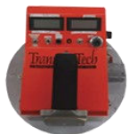
PQI Prototype 1996