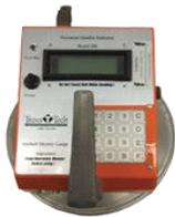
PQI 200 1999