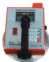
PQI 301 Series 2001-2004