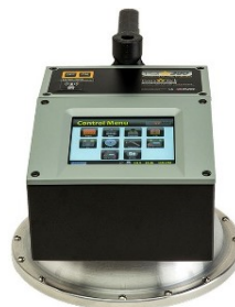
PQI 380 2010